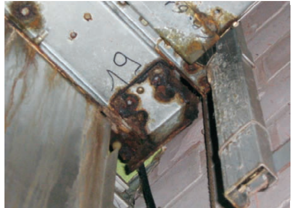
Kooiframe en ondergeleiding in conditie 4