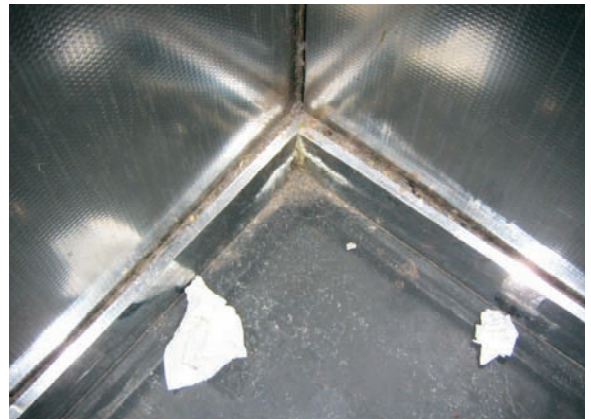
Liftkooi in conditie 3