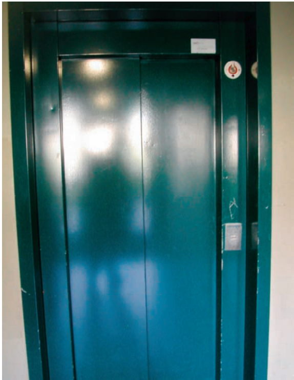
Schachttoegang in conditie 2