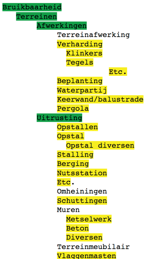
Tabel 3.1: Boomstructuur van de SEL in groene regels (processen, functies), witte regels (elementen) en gele regels (specificaties)

Bij de beschrijving gaan we uit van verzameling elementen die gerekend worden tot eenzelfde proces, bijvoorbeeld terreinen, omhulling, onderbouw, etc. (bouwkunde). In de boomstructuur van de SEL zijn dat de zogenoemde 'groene' regels. De te beschrijven elementen staan in deze boomstructuur in de zogenoemde 'witte' regels en zijn ingedeeld naar een of meer gemeenschappelijke functies, bijv. constructie, afwerking en uitrusting (zie tabel 3.1).