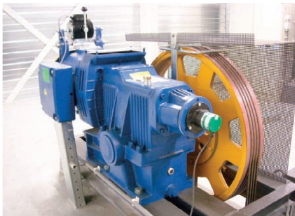
Liftaandrijving in conditie 1

dagstukken of muurkopbekledingen. Bij roltrappen een lichte beschadiging op de balustrade of sokkels. Er is geen slijtage waarneembaar. Er zijn geen defecte balustrade- of trede verlichtingen. Bij gevelonderhoudsinstallatie kan een beschadiging van de gondel of werkbak aanwezig zijn. De transportinstallatie en zijn omgeving voldoen aan de huidige externe regelgeving met betrekking tot toegankelijkheids-, arbo- en veiligheidseisen. Een alarminrichting is operationeel en uitgevoerd als spreek/luisterverbinding. De installatie is niet ouder dan 50% van de theoretische levensduur.