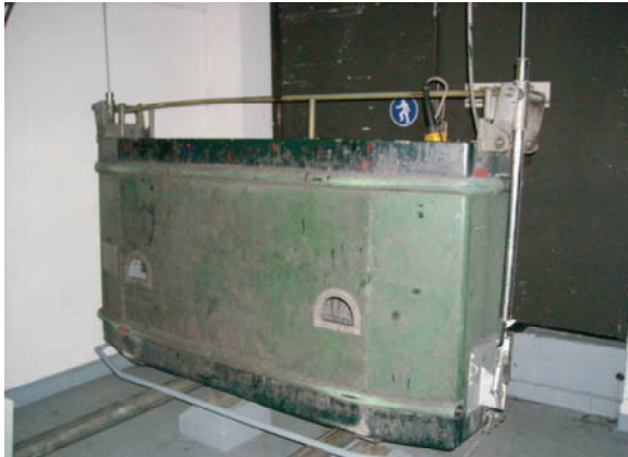
Gondel gevelonderhoudinstallatie in conditie 3