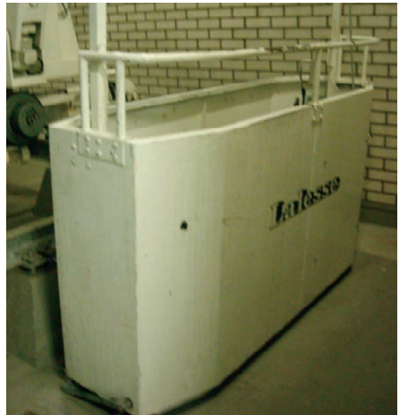
Gondel gevelonderhoudinstallatie in conditie