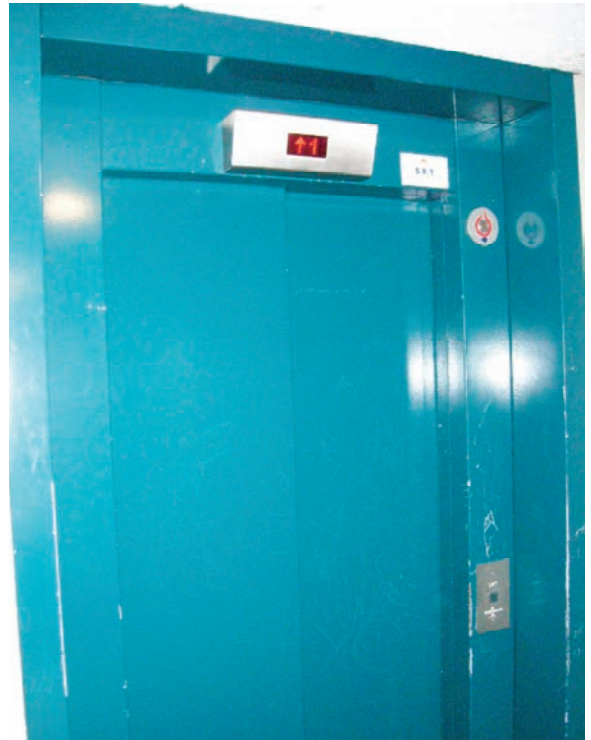
Schachttoegang in conditie 2