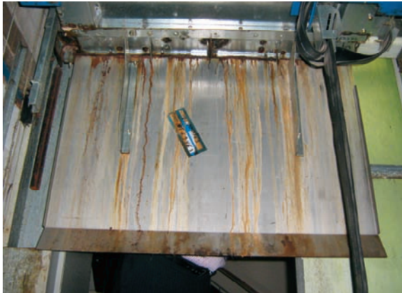
Kooiframe en ondergeleiding in conditie 4